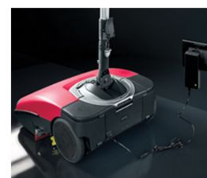
si ricarica in modo semplice e veloce.