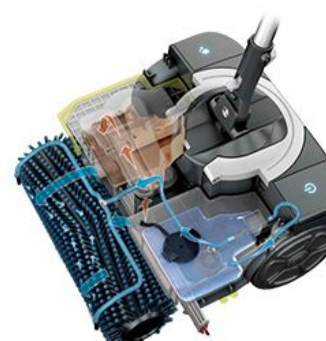
lava e asciuga istantaneamente